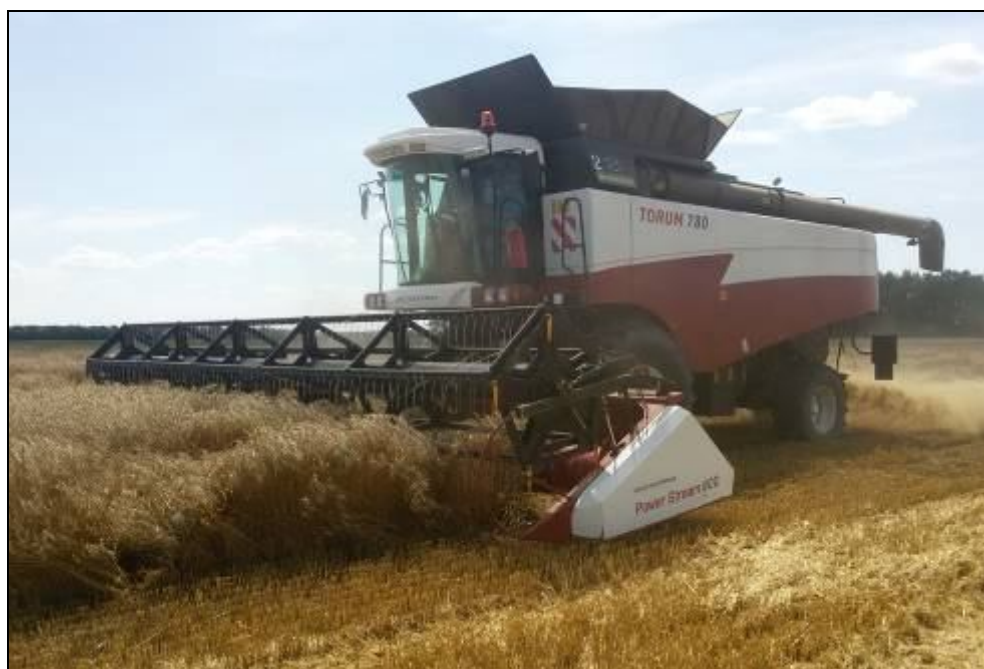
Рисунок 2 – Комбайн зерноуборочный РСМ-181 "TORUM-780" на прямом комбайнировании озимой пшеницы