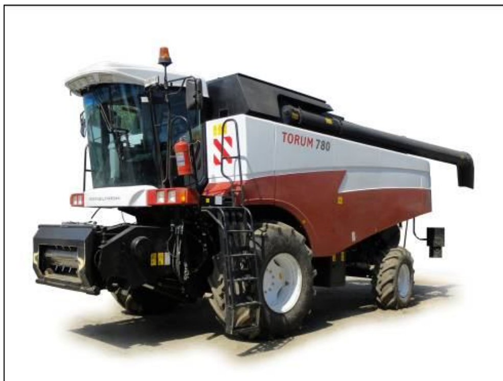
Рисунок 1 – Комбайн зерноуборочный РСМ-181 "TORUM-780", вид спереди слева