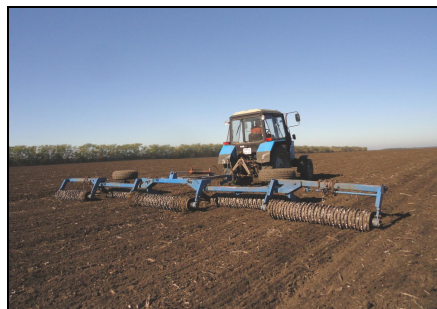
Каток кольчато-зубчатый ККЗ-9,2Н с трактором МТЗ-82 на прикатывании посева озимой пшеницы