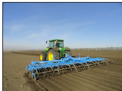
Культиватор Korund 8/900 К в агрегате с трактором Джон Дир 8420 на предпосевной культивации