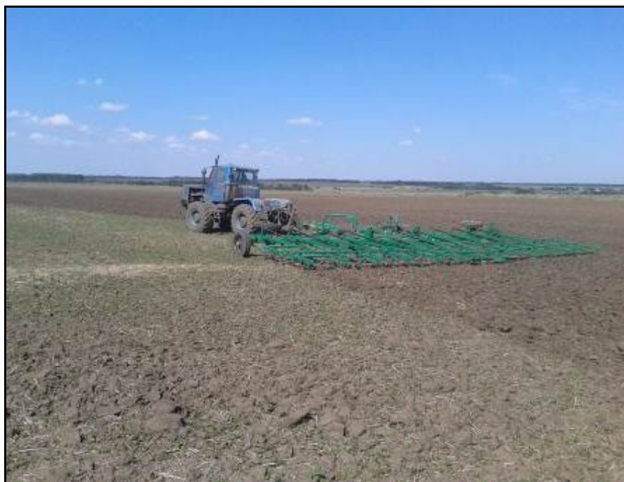
Рисунок 2 – Борона широкозахватная гидрофицированная БШГ -15-К1 "Пустельга" в агрегате с трактором Т-150К на разрушении почвенной корки перед посевом озимых

15.10.2021 г. в ООО "Солнечное", проведена контрольная смена с определением эксплуатационно-технологических и агротехнических показателей качества работы борона в агрегате с трактором Т-150К на разрушении почвенной корки перед посевом озимых.