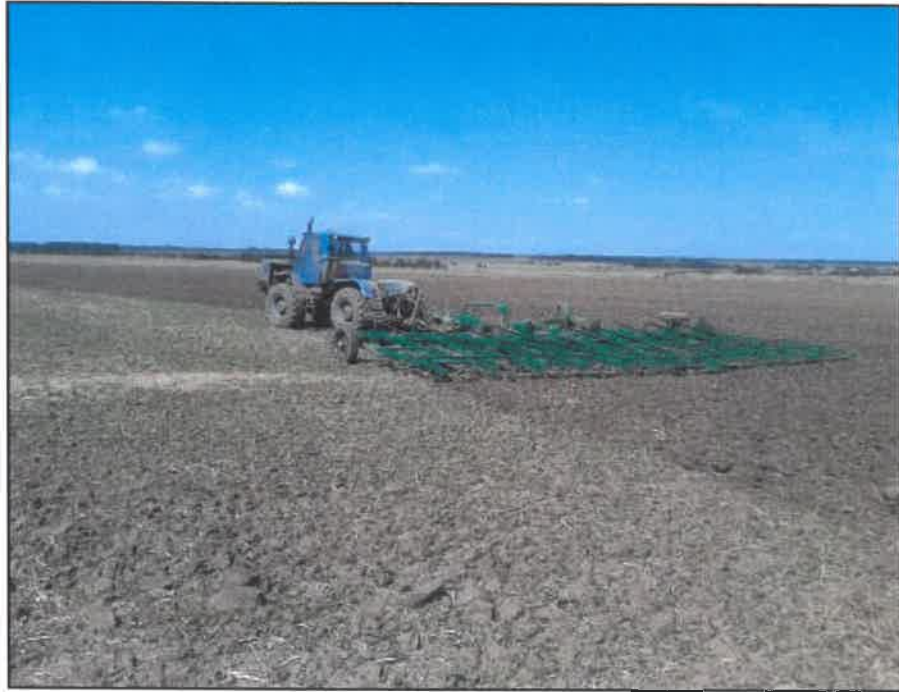
Рисунок 2 – Борона широкозахватная гидрофицированная БШГ -15-К1 "Пустельга" в агрегате с трактором Т-150К на разрушении почвенной корки перед посевом озимых