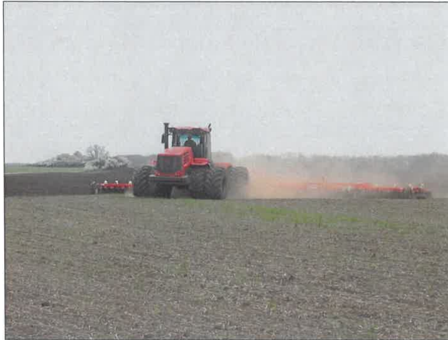
Рисунок 2 – Средний предпосевной культиватор "Tillermaster-18000" в агрегате с трактором К-744 Р4, на предпосевной сплошной культивации