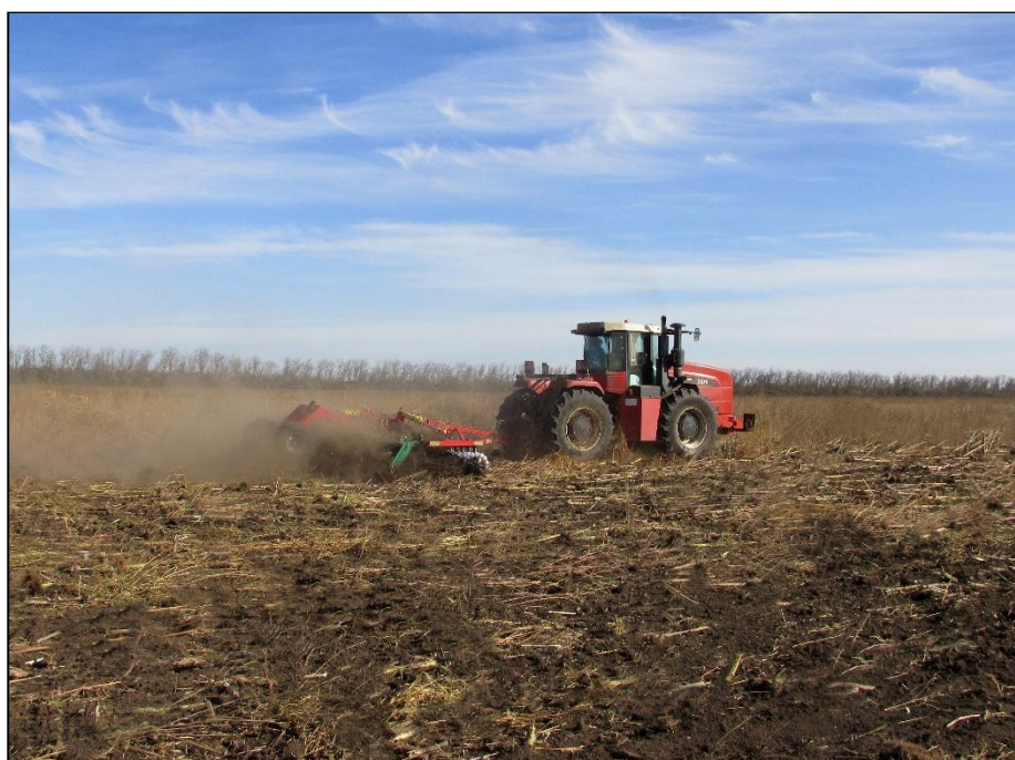
Рисунок 3 – Борона дисковая модернизированная марки "Диас", модель БДМ-7×2ПК-Д-ШКС в агрегате с трактором Versatile 2375 на дисковом лушении пожнивных остатков подсолнечника (1 след)