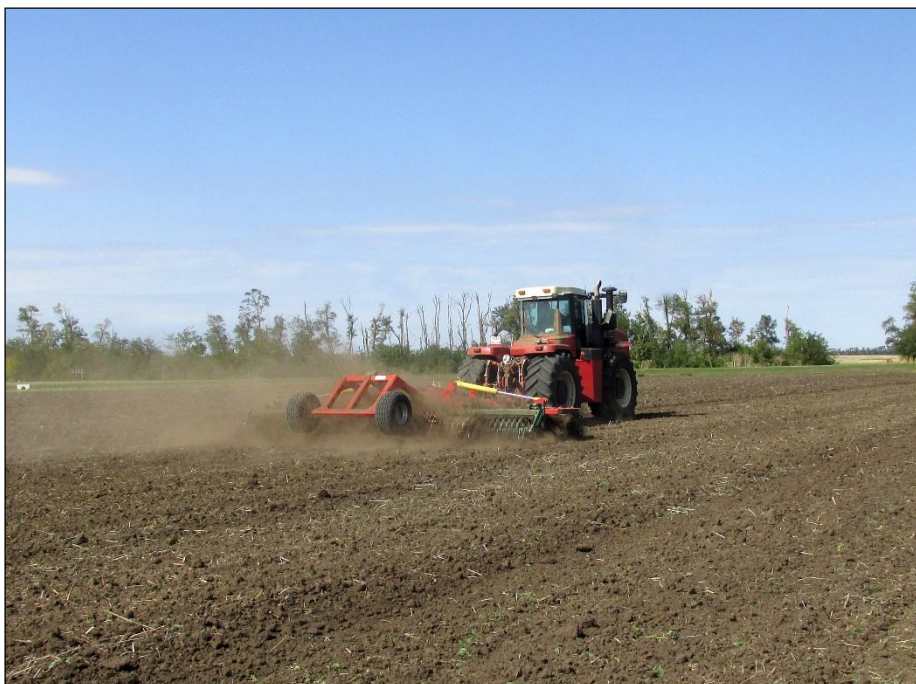
Рисунок 2 – Борона дисковая модернизированная марки "Диас", модель БДМ-7×2ПК-Д-ШКС в агрегате с трактором Versatile 2375 на дисковом лушении стерни озимой пшеницы (2 след)