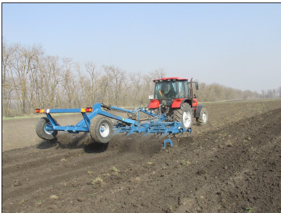
Рисунок 2 – Культиватор предпосевной торговой марки "TIGARBO" модель КПП-6 в агрегате с трактором Беларус-1523, на сплошной культивации