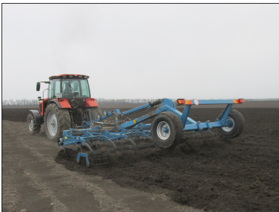
Рисунок 3 – Культиватор предпосевной торговой марки "TIGARBO" модель КПП-6 в агрегате с трактором Беларус-2022, на предпосевной культивации