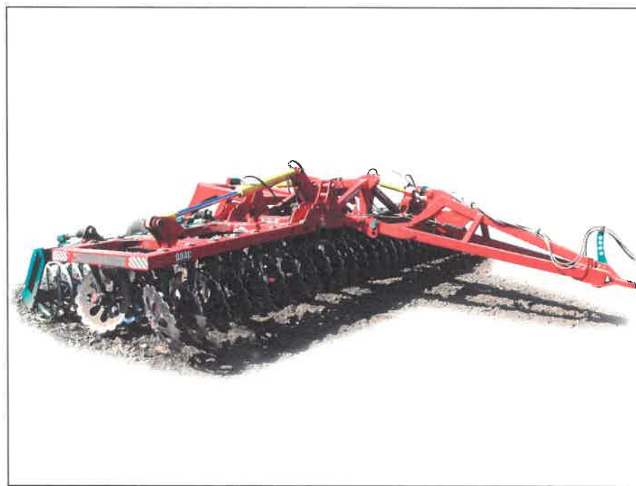
Рисунок 1 – Борона дисковая модернизированная марки "Диас", модель БДМ-7×2ПК-Д-ШКС, вид спереди справа

Агрегатируется с тракторами тягового класса 5-6.