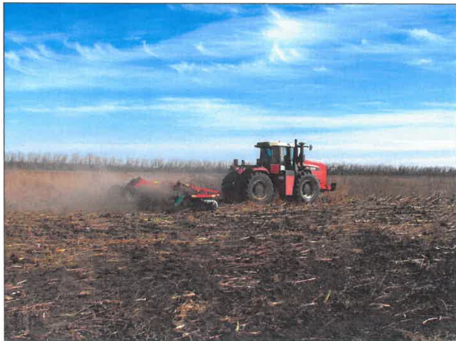
Рисунок 3 – Борона дисковая модернизированная марки "Диас", модель БДМ-7×2ПК-Д-ШКС в агрегате с трактором Versatile 2375 на дисковом лушении пожнивных остатков подсолнечника (1 след)