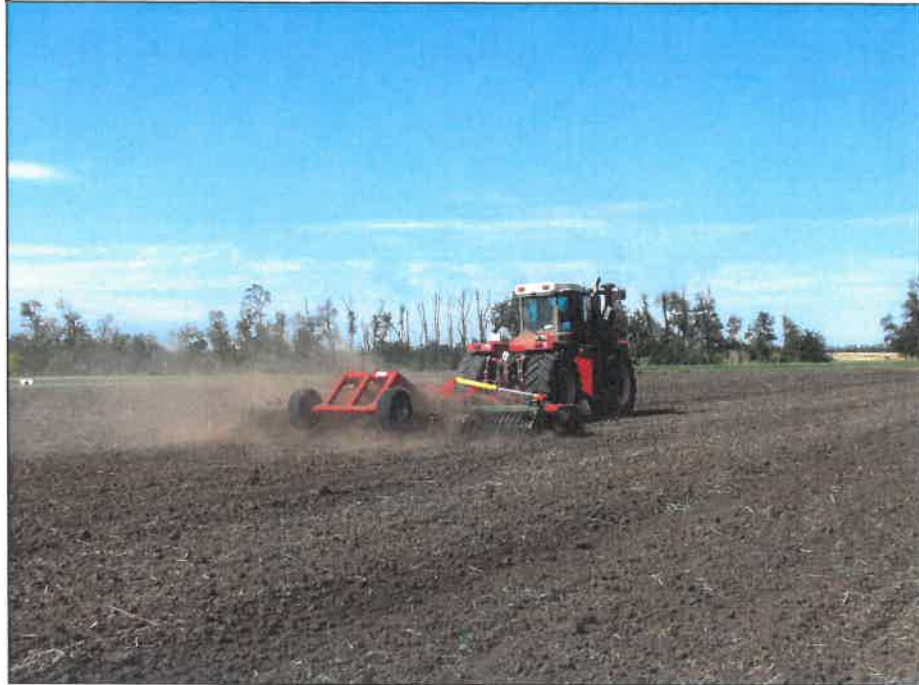
Рисунок 2 – Борона дисковая модернизированная марки "Диас", модель БДМ-7×2ПК-Д-ШКС в агрегате с трактором Versatile 2375 на дисковом лушении стерни озимой пшеницы (2 след)