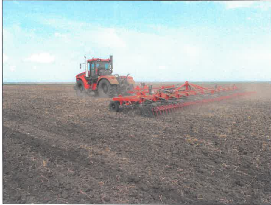
Рисунок 2 – Культиватор сплошной, серии КС(У), модели КС-14(УС)-03.00 EURO в агрегате с трактором К-742 МСт1 "Кировец", на предпосевной культивации почвы