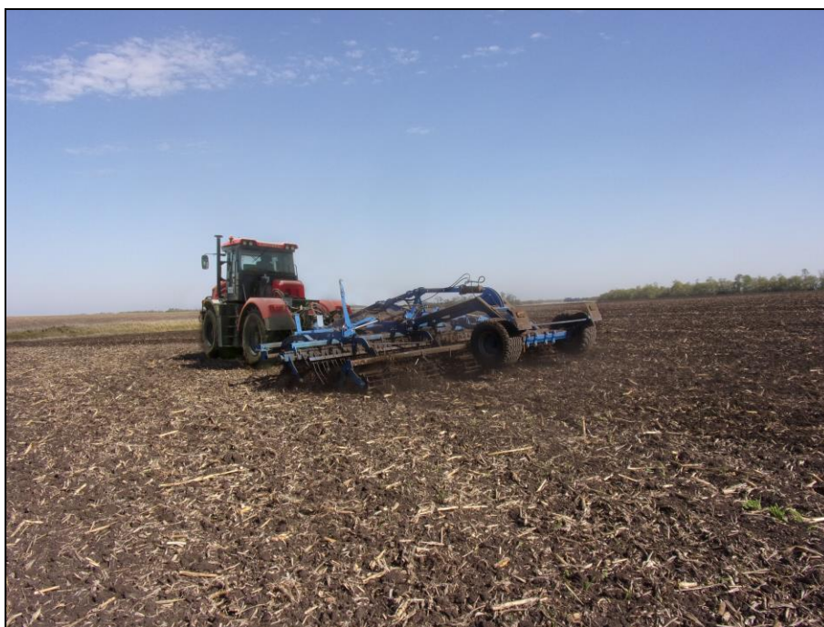
Рисунок 3 – Борона дисковая МІХ-800, в агрегате с трактором Кировец К-525Пр на дисковом лушении пожнивных остатков кукурузы