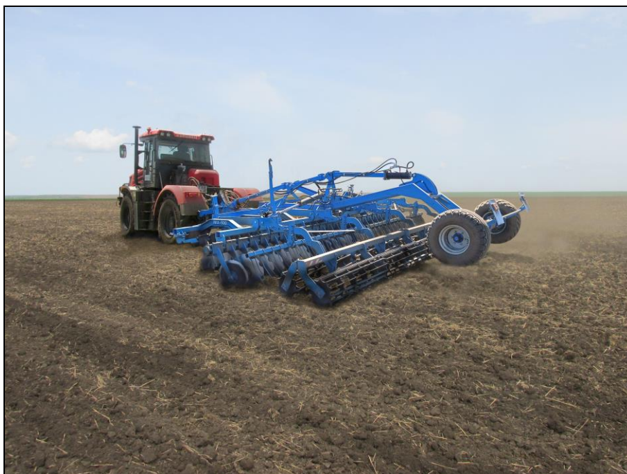
Рисунок 2 – Борона дисковая МІХ-800, в агрегате с трактором Кировец К-525Пр на дисковом лушении стерни озимой пшеницы